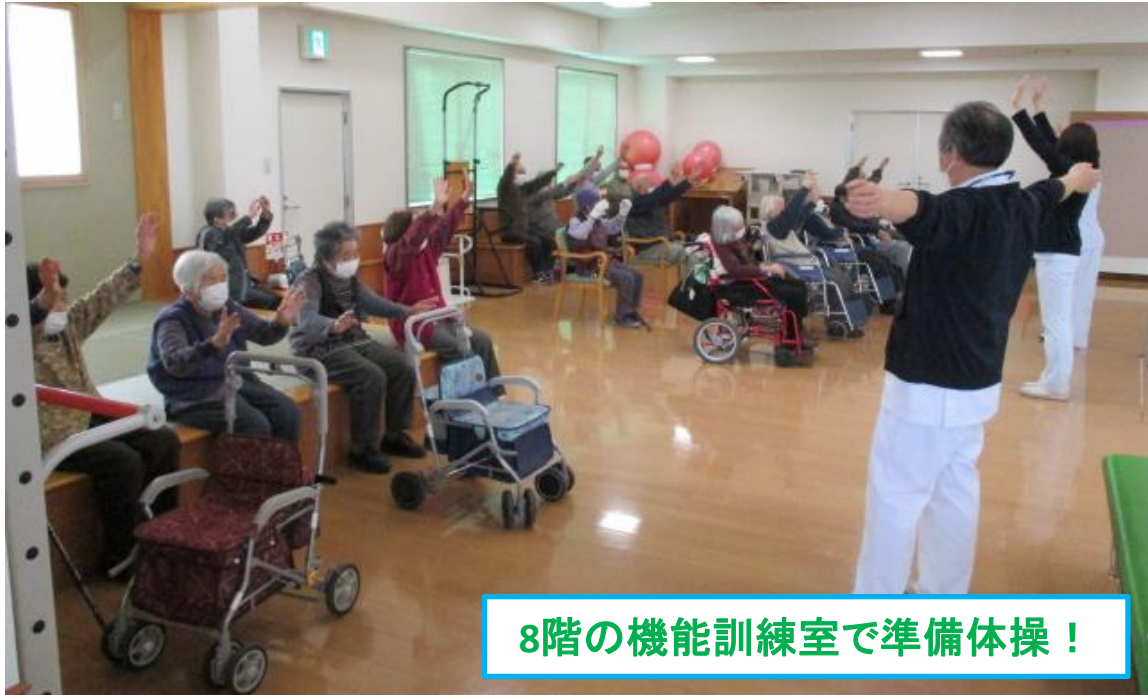
8階の機能訓練室で準備体操！