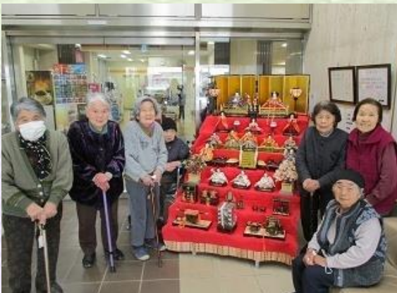
皆さん!お雛様のように美しい♡