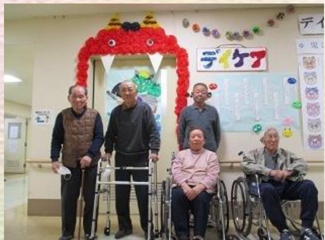
鬼の飾りの前で記念撮影☆