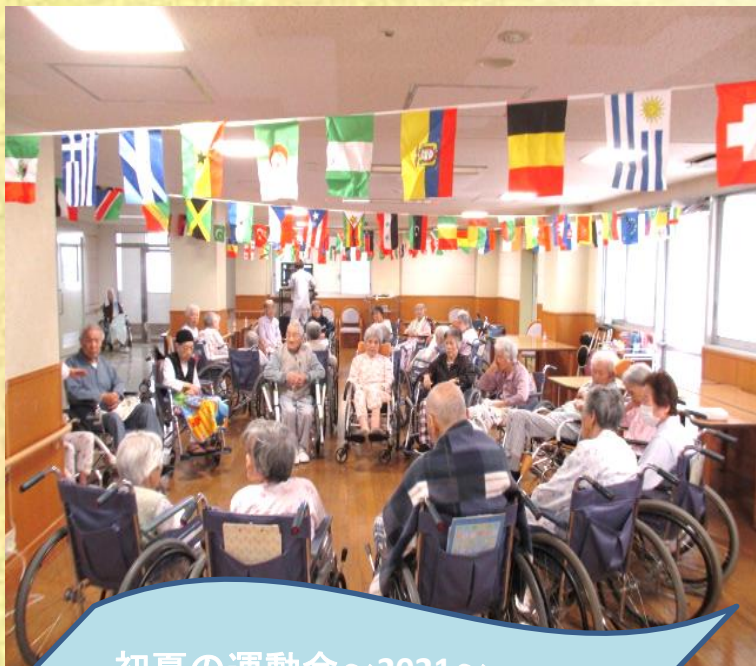
初夏の運動会～2021～ 今年は、各フロアで行いました。