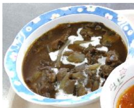
ビーフストロガノフ(ロシア)

遠方に出向くことが難しい中、世界各地に出掛けた気分だけでも味わっていただけるよう試みています。次回7月は、タイ料理を検討中です。ぜひお楽しみに！