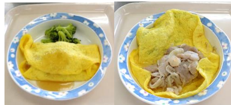
バインセオ(ベトナム)